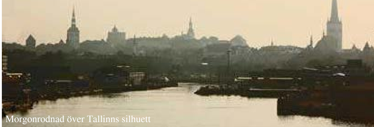
Morgonrodnad över Tallinns silhuett