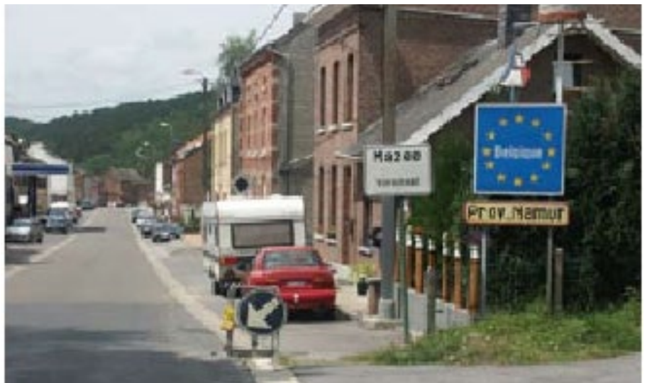
Statsgräns mellan Frankrike och Belgien.

Belgien Cypern Estland Finland Frankrike Grekland Irland Italien Luxemburg Malta Nederländerna Portugal Slovakien Slovenien Spanien Tyskland Österrike