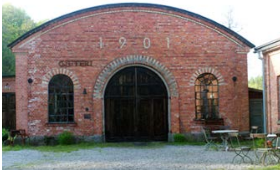
Det gamla gjuteriet