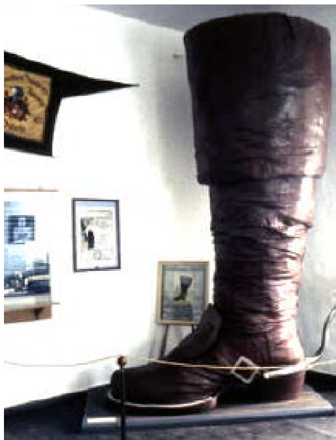
Jättestöveln i Mildenstein

Den bäst bevarade gotiska borgen är Kriebstein från 1200-talet. Den tronar på en brant klippa och är med sina hemliga gångar och kantiga torn prototypen för en riddar-