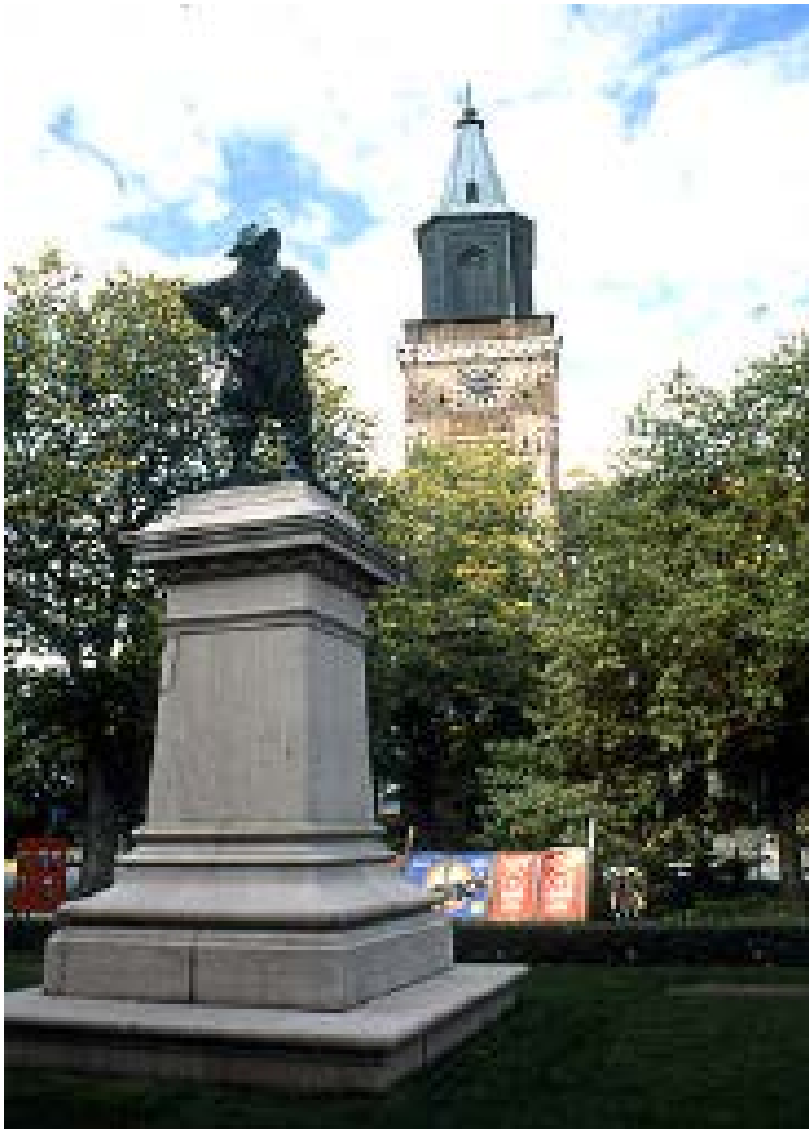
Per Brahe står staty med domkyrkan i bakgrunden