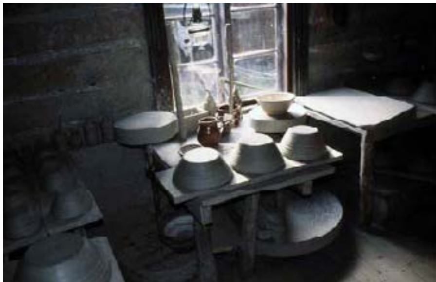
Gårdsinteriör på Klosterbackens Hantverks-museum.

Av bestående byggnader från 1200-talet utgör det fint restaurerade Åbo slott den främsta