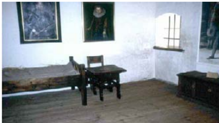
Hertig Karls kammare

Bakom domkyrkan står Brinkalahuset från vars balkong magistratssekreteraren i Åbo utlyser Julfreden. Det gör han på julaftonen när domkyrkoklockan slagit tolv. Talet som hålls på urgammal finska och svenska, är en tradition alltsedan drottning Kristinas dagar med undantag av Stora Ofreden och Vinterkriget år 1939.