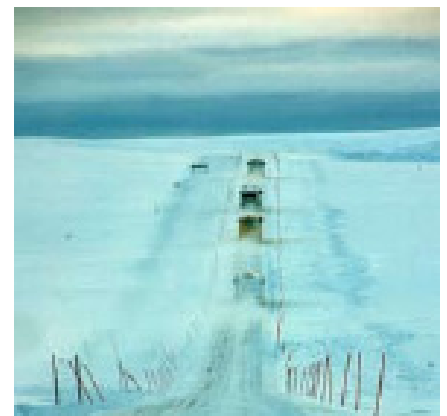
Bussar på väg till Nordkap

Ibland uppstår diskussioner om huruvida klippan är den nordligaste punkten eller om det inte i själva verket är Kinnarodden som Hurtigruten rundar några timmar