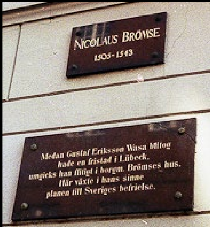
Här bodde Gustav Vasa