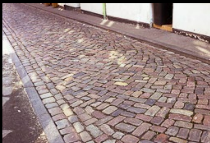
Gatsten från Bohuslän