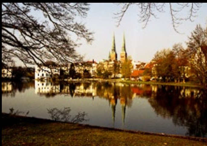
Morgonrodnad över Lübeck