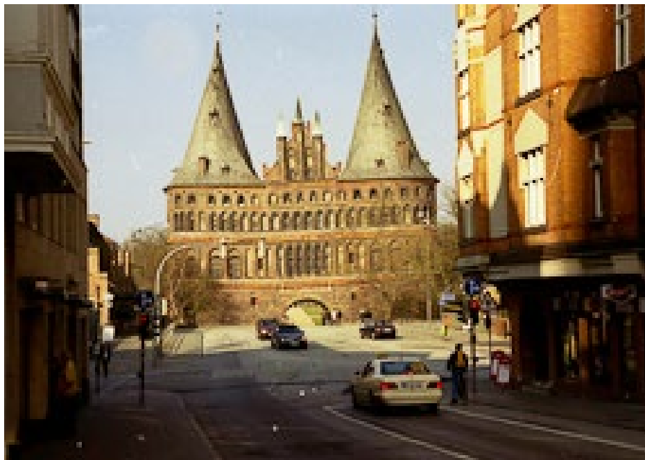
Symbol. Lübecks ansikte utåt. Holstentor, står fortfarande stadigt.

Stadens medelpunkt ligger kring det lilla torget som domineras av råd-huset (med Gustav Vasas staty). I Rote Saal kan vi beskåda en stor målning föreställande sjöslaget utanför Gotland år 1564 som visar hur krigsfartyget "Ängeln" från Lübeck erövrar det svenska amiralskeppet "Makalös". I rådhuset ligger också stadens turistbyrå