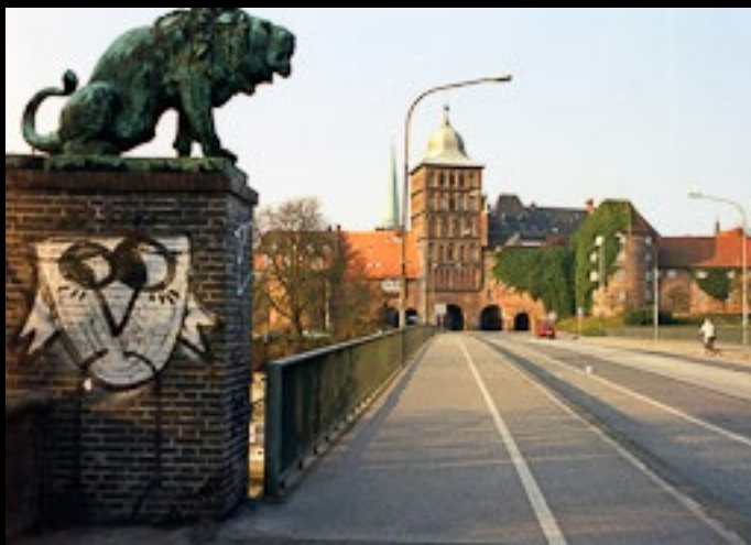
Infart till Lübeck