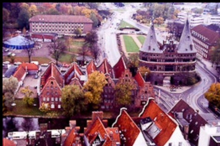
Utsikt från Petrikyrkans torn