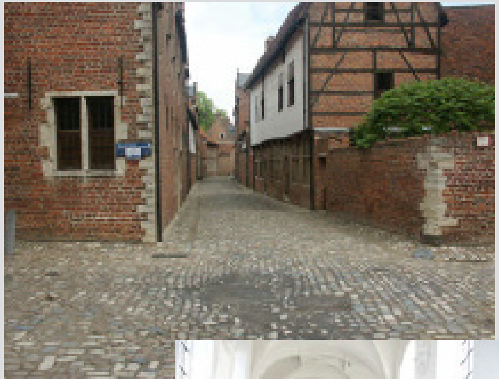
Beguinergården i Leuven