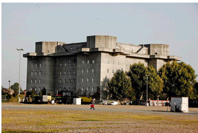
Luftskyddstorn från andra världskriget.