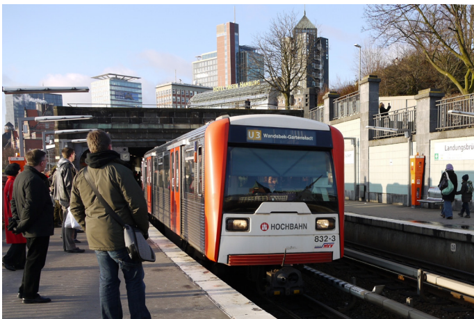
Vid Landungsbrücken

Resan går förbi parker, över kanaler, där den längsta bron mäter 65 meter. I centrum dyker den ner i underjorden för att passera fem stationer innan den dyker upp igen strax bakom Rådhuset. Där möts resenären av en av de mest kända turistattraktionerna i staden. På en stålkonstruktion med 38 pelare förbi de till bostäder och kontor restaurerade hamnmagasinen, hamnen och Landungsbrücken. Tåget rasslar därefter förbi den berömda marknaden i St Pauli och Reeperbahn innan det passerar Millern-torstadion.