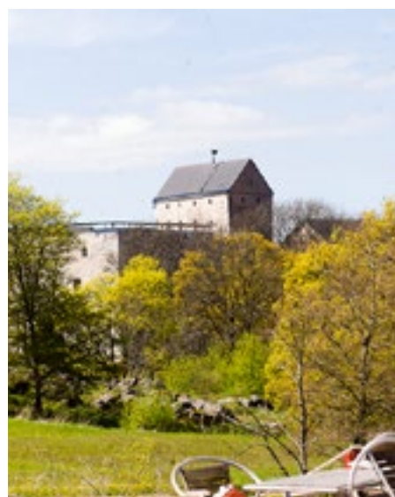
Från Smakbyn har man fin utsikt mot Kastellholms slott