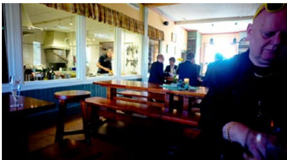
Hos Stallhagen lagas maten inför öppen ridå

Resultatet är lanseringen av en autentisk replika av vrakölet som getts namnet Stallhagen Historic beer 1843.