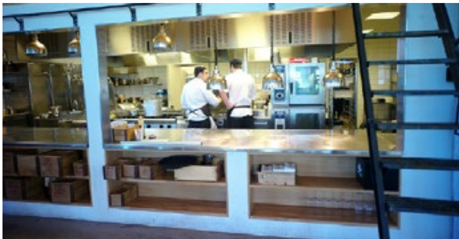
I Smakbyn sker matlagningen med full insyn.

Smaka på en äkta ålandspannkaka som serveras med plommonpuré och vispgrädde. Gärna med något gott att dricka till - om du inte kör bil.