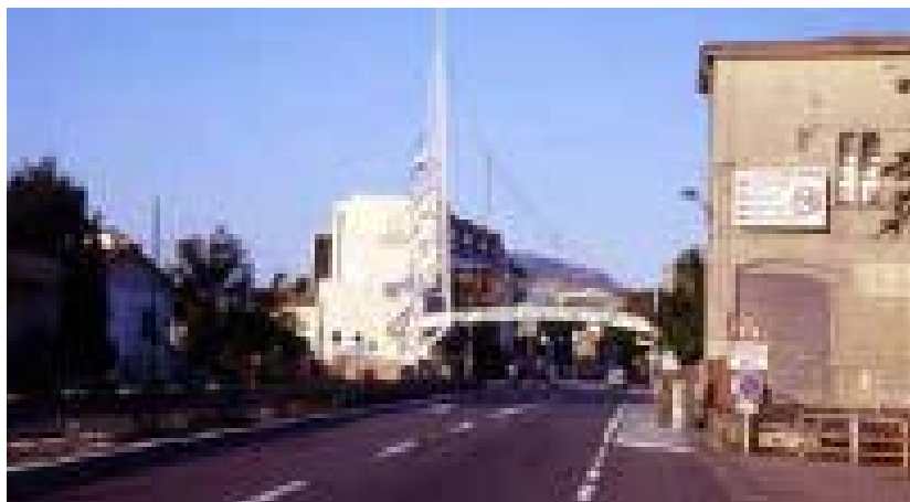
Äntligen framme. Under en välkomnande skylt åker man in i republiken San Marino där det råder 70 km/tim.