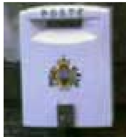
Naturligtvis ska ett frimärksland ha snygga brevlådor