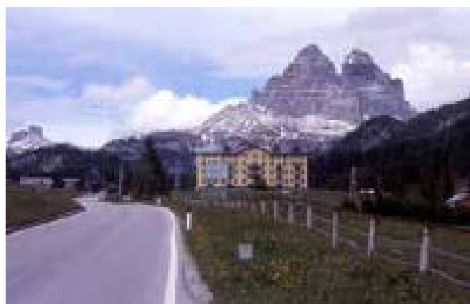
Monte Titanos toppar ser imponerande ut på avstånd.

Några andra sevärdheter än idyll erbjuds inte, men man kan inte få allt.