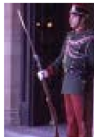
Rådhuset vaktas av statens yrkessoldater.

Största stad är industri- och gränsstaden