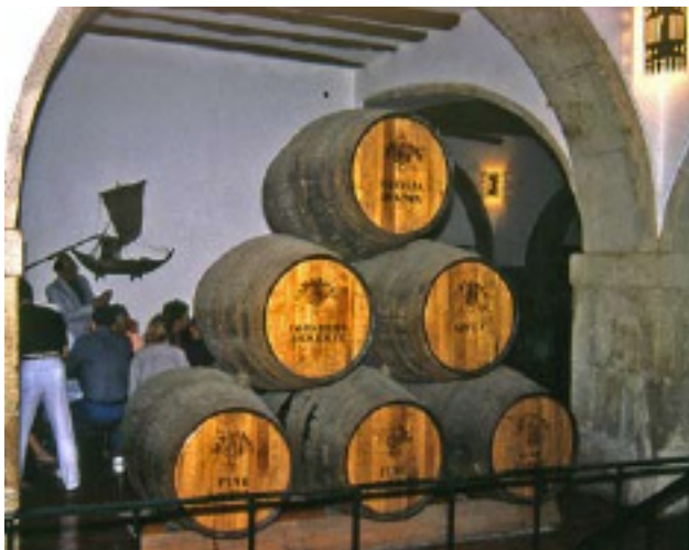
Ovan; I vinkällaren.

Th; Är de inte duktiga, portugisiskorna när de balanse- rar sina tunga bördor på huvudet.