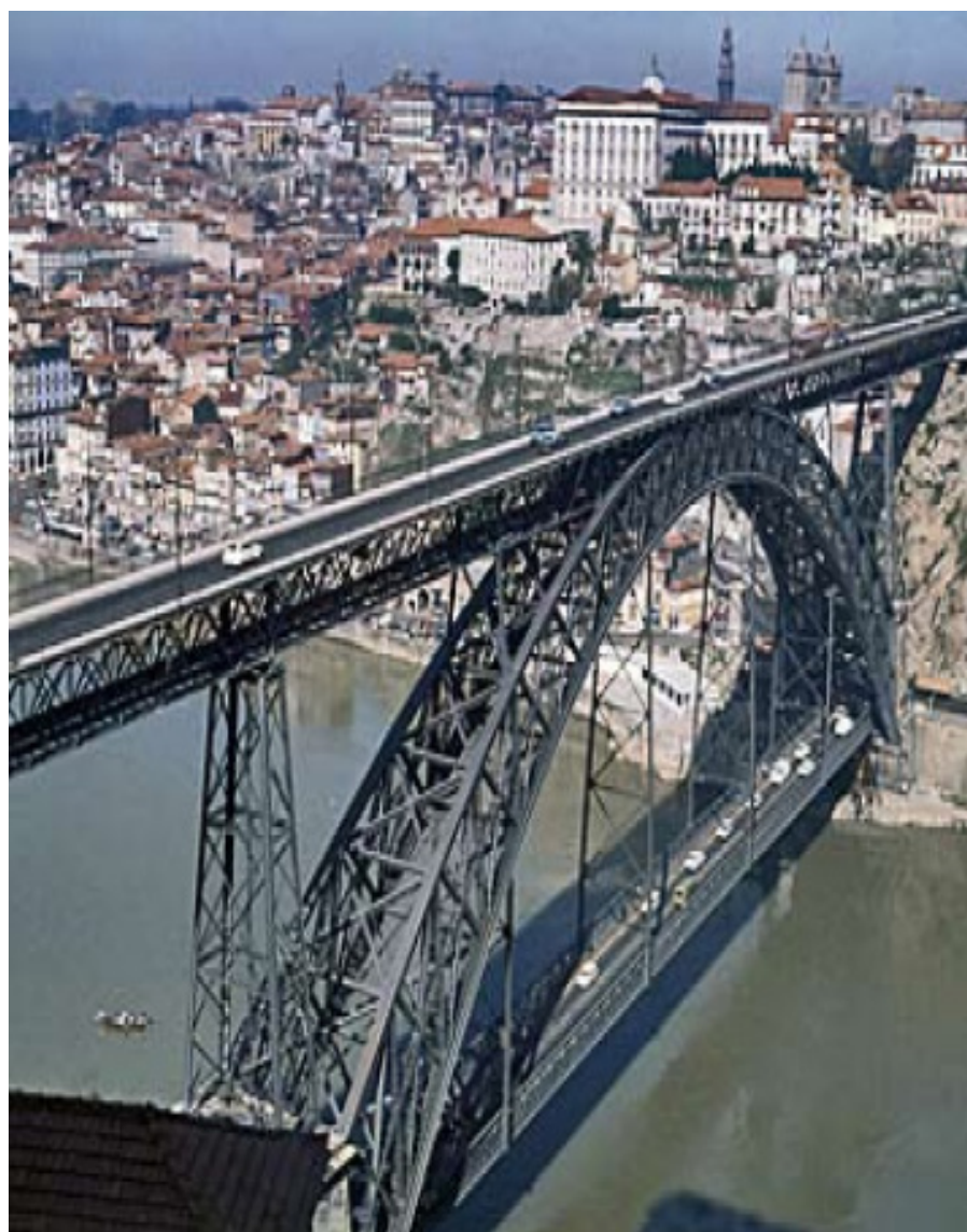
Gamla bron över floden Duoro.