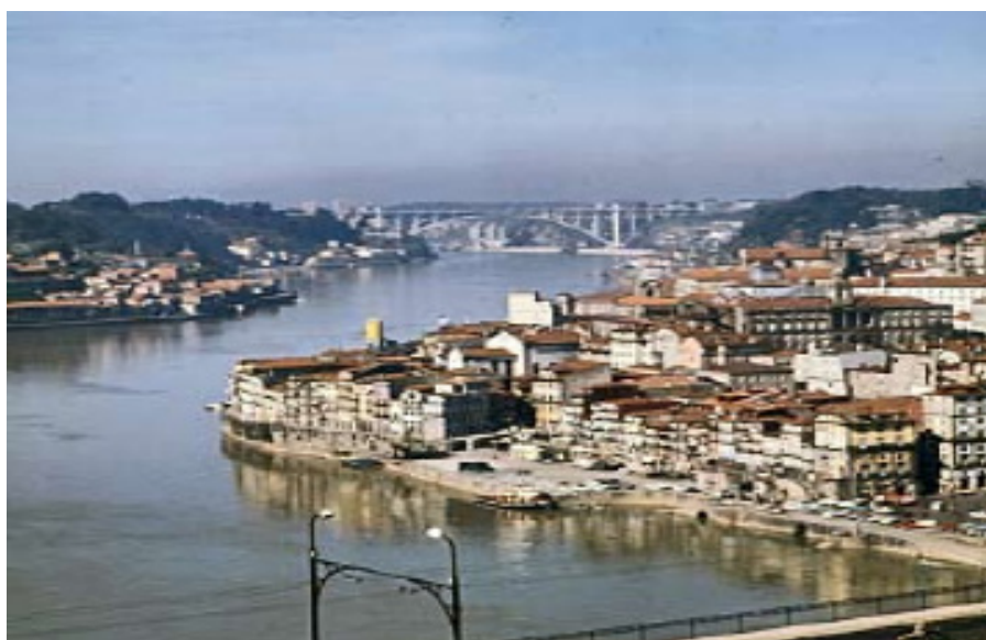
Utsikt över gamla Oporto md den nyaste bron över Duoro, Ponte Arrábida,

"Portvin - det enda vin i vilket en skål för engelske kungen el- ler drottningen får utbringas".