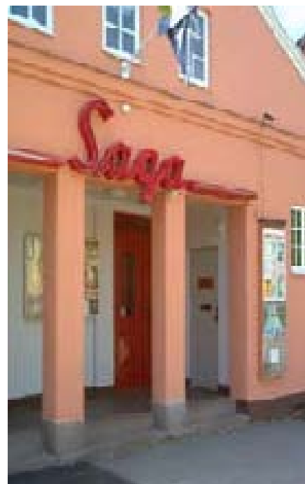
Sagabiografen i Vetlanda

De sjöng den alltid på sina världsturneèer.