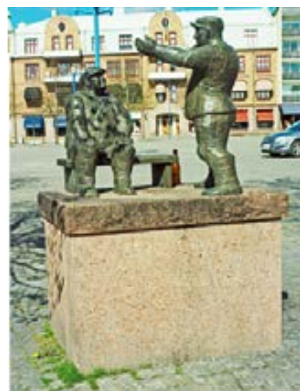
Åsa-Nisse och Klabbarpan på torget i Vetlanda